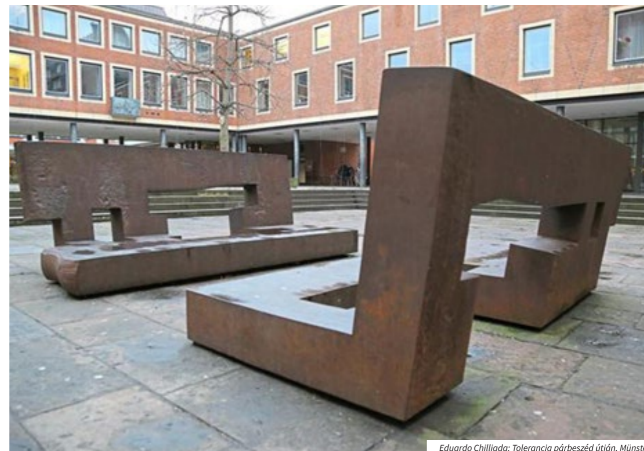
Eduardo Chillida: Tolerancia párbeszéd útján, Münster

Egy-egy köztéri szobor, emlékmű felállítása örökre, illetve - tapasztalataink alapján legalábbis – évtizedekre megváltoztatja az adott közteret, a döntéshozók felelőssége tehát vitathatatlanul jelentős. Miközben elfogadjuk az olyan állításokat, hogy például a reklámok akkor is hatnak ránk, ha nem is figyelünk oda rájuk, azt gondoljuk, a köztereinken minket körülvevő vizuális élményekre ez nem igaz? Ezek a bántó vizuális hatások a mindennapok során tudattalanul beépülnek, megszokjuk ezen emlékművek jelenlétét.