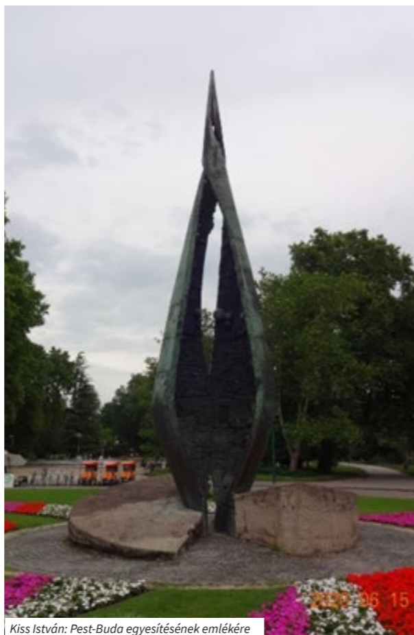
Kiss István: Pest-Buda egyesítésének emlékére

A szoborkoncepció célja a következő négyéves ciklusra kijelölni azokat az irányokat, amelyek mentén a köztérrekről és a köztéren elhelyezendő művészeti alkotásokról gondolkodni, beszélni szeretnénk. Ennek szorosan kapcsolódnia kell minden, a fővárost érintő fejlesztési koncepcióhoz , hiszen egyetlen közterületre vonatkozóan sem lehet döntést hozni anélkül, hogy alapos vizsgálatra került volna az ott fellelhető vagy elhelyezendő művészeti alkotások kérdése.