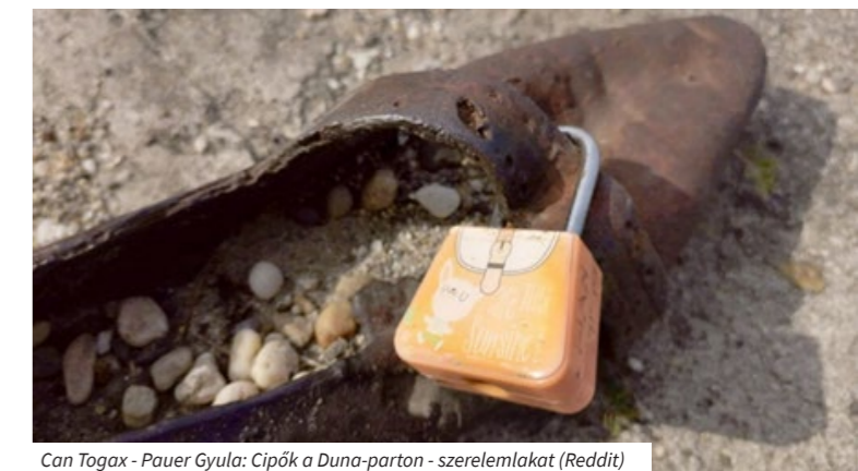
Can Togax - Pauer Gyula: Cipők a Duna-parton - szerelemlakat

A fővárosi szobrok közül több emlékmű esetében tapasztalható a szándékos rongálás, károkozás annak témája miatt (pl. Roma Holokauszt Emlékmű, Cipők a Duna parton Emlékmű, stb.). Ezek védelme ügyben a Fővárosi Rendészeti Igazgatóság (FŐRI) speciális kamerás védelem kiépítésén dolgozik. 2020. szeptemberétől kamerás védelem alá kerül a Roma Holokauszt Emlékmű, valamint Cipők a Duna parton Emlékmű. Ezek mellett azonban további kb. 70 fővárosi tulajdonú mű esetében indokolt a védelem, amelyekre megoldást akár a már meglévő rendszer bővítése jelenthetne.