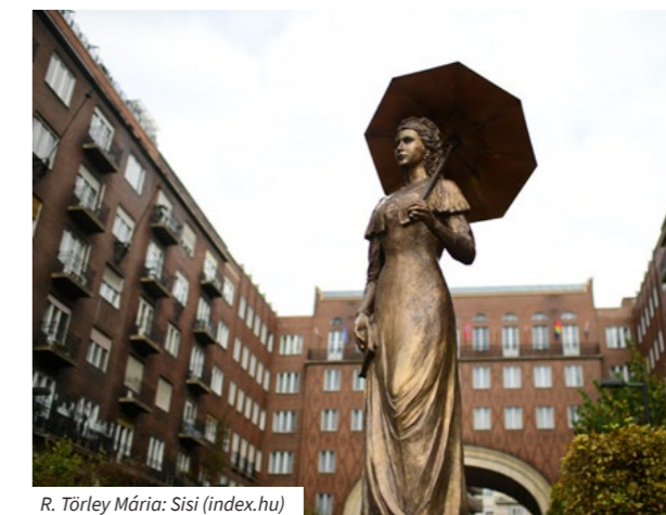
R. Törley Mária: Sisi

A Köztéri Egyeztető Fórum célja megosztani a tapasztalatokat , jó gyakorlatokat, összehangolni a szoborállításokat, kiemelten az olyan események kapcsán, mint az egyes évfordulók, amikor hasonló tematikában a főváros több pontján várható emlékállítás. Fontos volna a közeljövőben aktuálissá váló történelmi események, jelentős személyiségekhez kapcsolódó évfordulók előzetes feltérképezése, illetve azoknak a már létező köztéri szobroknak a számbavétele, amelyek a közelgő évfordulókhoz közvetlenül, vagy közvetetten köthetőek (tulajdonostól függetlenül).