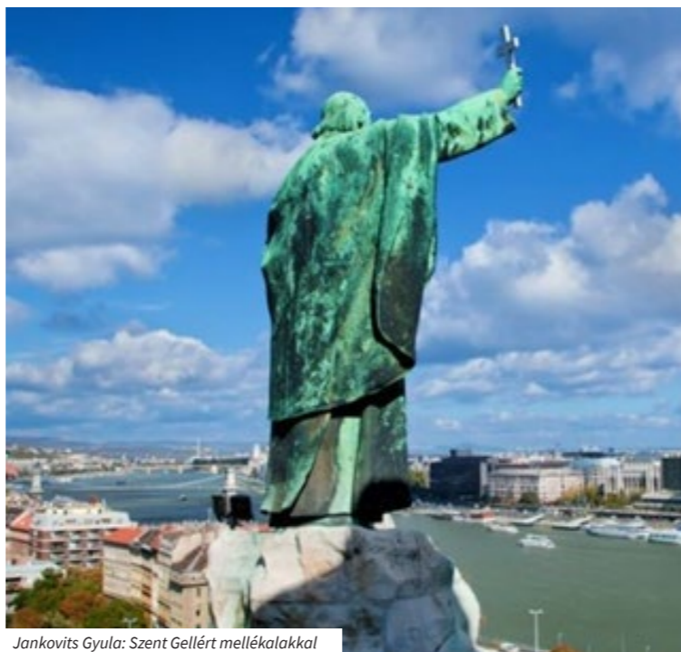
Jankovits Gyula: Szent Gellért mellékalakkal

A feladatok elvégzését nehezíti, hogy sok esetben áll kerületi területen fővárosi tulajdonú szobor, illetve kerületi tulajdonú szobor fővárosi területen. Jelenleg a felújítások elvégzéséhez közterület használati engedélyt kell kérni, amely gyakran – még egy ilyen közfeladat esetében is – díjköteles. Az is többször előfordult, hogy a Főváros hozzájárulásával az adott kerület elbontotta a műalkotást, majd a visszaállítását nem eredeti formában vagy egyáltalán nem kívánta elvégezni.