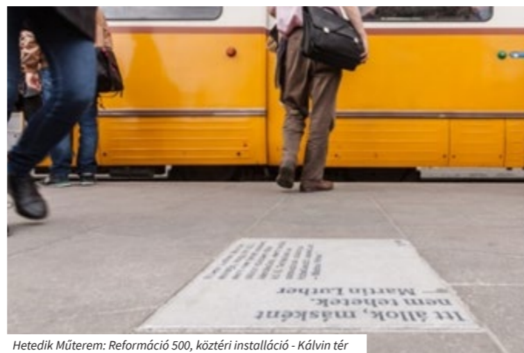
Hetedik Műterem: Reformáció 500, köztéri installáció - Kálvin tér

„A köztéri szobrászat ... finanszírozása egyelőre közpénzből történik, az adófizetők pénzéből, elvárható lenne, hogy megtanítsák nekik, hogy mi a plasztika, mi a köztér, és hogy ott mi folyik. És ha megtanulta, megismerte, akkor majd a sajátjának is fogja érezni, esetleg szoros, szeretetteljes kapcsolatba kerül vele... el kell hagynunk az elitizmust és az értelmiségi gögőt, és a kultúra társadalmasítására kell helyeznünk a hangsúlyt...”