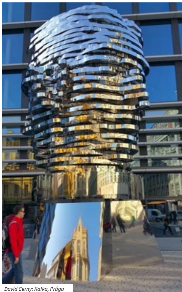
David Cerny: Kafka, Prága

Cél, hogy a Fővárosi Önkormányzat, együttműködve a kerületekkel és a szakértői feladatokat ellátó szervezetekkel, előkészítse és az Országgyűlés számára benyújtsa a helyi önkormányzatok és szerveik, a köztársasági megbízottak,