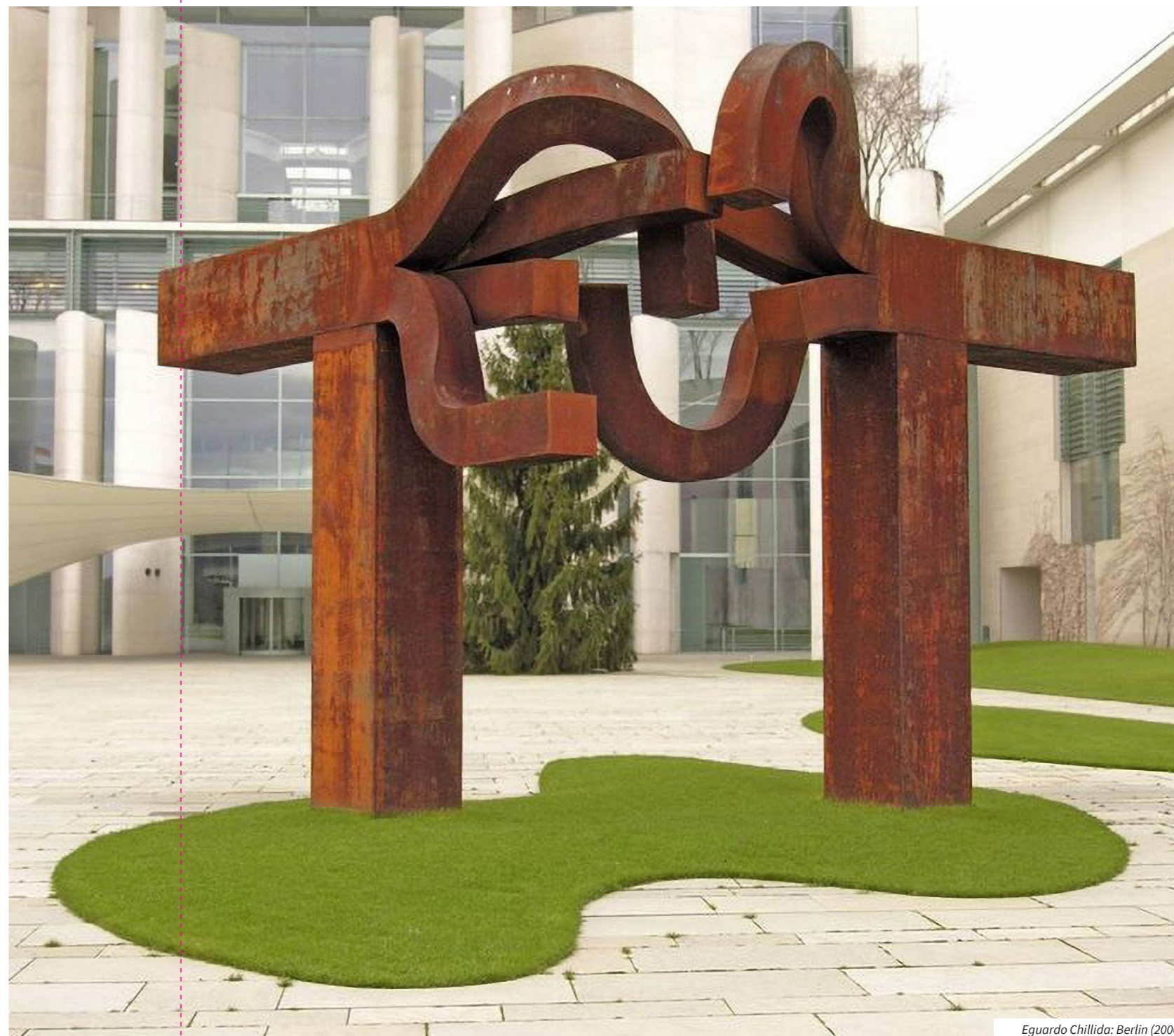
Eduardo Chillida: Berlin (2000)

A hazai köztéri alkotások megszületése mögött alapvetően emlékezetpolitikai okok állnak, vagy ha nem, „ szerehető ” zsáner szobrokkal népesítik be a köztereket. Miért van az, hogy míg pl. Chicagóban hatalmas Picasso, Calder, Anish Kapoor szobrokkal találkozik az ember, addig Budapesten az autonóm szobrászat alig tud helyet találni magának? Miért van az, ha egy jelentős személy vagy esemény megörökítése a cél, az csak monumentális figurális alkotásként, Zala György és Stróbl Alajos munkásságát megidézve képzelhető el, miközben rengeteg példa van arra, hogy egy-egy történelmi eseményre, személyre autonóm művek emlékeznek, elég csak Eduardo Chillida munkásságára gondolnunk.