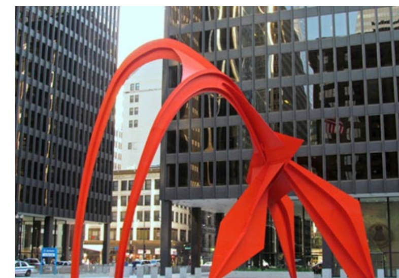
Alexander Calder: Fleming, Chicago

ketet számára fontos események (pl. 48-as, 56-os emlékművek, nemzeti összetartozás stb.) ugyanakkor számos olyan egyetemes jelentőségű és aktuális téma van, amely a társadalmi konfliktusok forrásai közé tartozik, és amely kapcsán még a párbeszéd, vita lefolytatása szükséges. Mindehhez segítség lehet a nyilvános térbe helyezett, ideiglenesen felállított mű, amely mentén a társadalmi párbeszéd kibontakozhat.